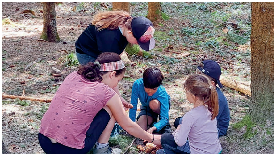
Spielen im Wald verbindet untereinander und mit der Natur.

Newsletter abonnieren und weitere Informationen: naturerlebniszug.ch