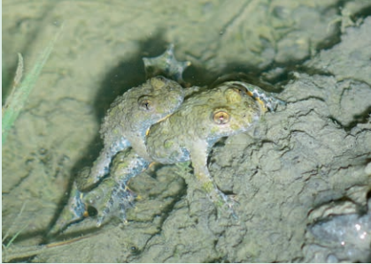
Die gefährdeten Gelbbauchunken waren die Schirmart der Aufwertungen von 2025.

Neben den Wannen haben wir verschiedene Strukturen wie Steinhäufen und Totholz angelegt, welche die Gelbbauchunke gerne als Versteckmöglichkeit im Sommer nutzt.