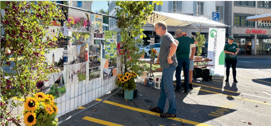
Wir haben am PARK(ing) Day 2025 auf dem Unteren Postplatz Zug gezeigt, wie wichtig mehr Natur im Siedlungsraum ist.