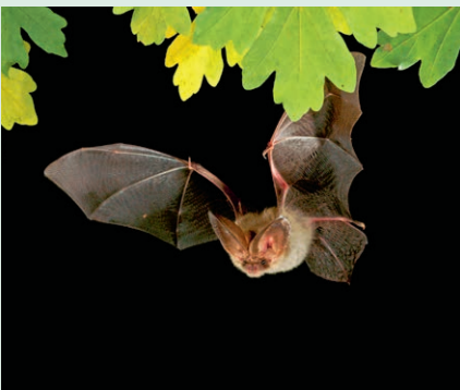
Ein Braunes Langohr im Flug.

Interessiert? Infos finden Sie unter wwf-zentral.ch/wiesel