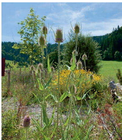
Sommer-Impression 2025. Wild und schön!

In Naturgärten finden 60 bis 80 Wildbienenarten und etliche andere Tier- und Pflanzenarten Wohn- und Verpflegungsmöglichkeiten. Ein besonders attraktiver Naturgarten ist das von Pro Natura Zug unterstützte Wildbiendli-Paradies Einsiedeln.