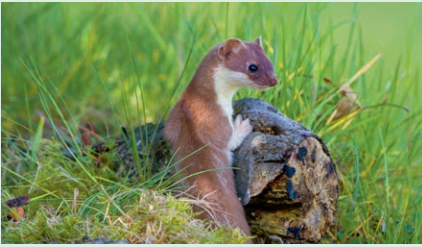
Wiesel sind ständig aktiv und huschen auf der Futtersuche von Versteck zu Versteck.